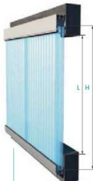
Instalación externa sin solera