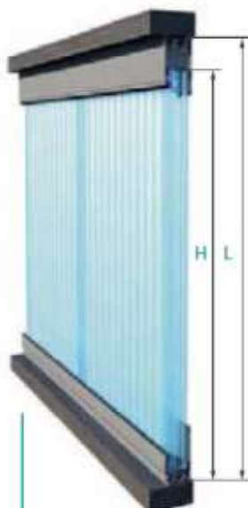
Instalación dentro del vano sin solera