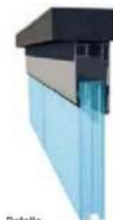
Detalle perfil superior de corte térmico