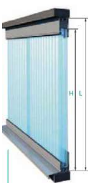
Instalación dentro del vano con solera