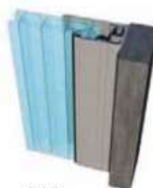
Detalle perfil lateral de corte térmico